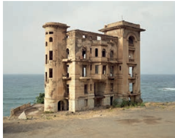
Photographie de l'affiche : Les ruines d'un palais colonial français dans la banlieue d'Alger, Algérie, 2007.