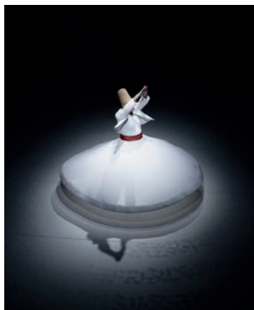
Nouredine Khourchid et les derviches tourneurs de Damas