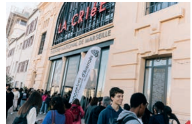
Rencontres d'Averroès, Marseille.