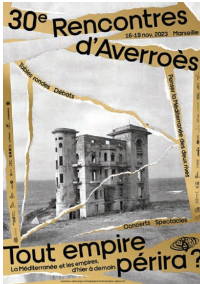
Affiche de l'édition 2023 © Adrien Bargin

À disposition de la presse, sur demande auprès de 2 e BUREAU : lesrencontresdaverroes@2e-bureau.com