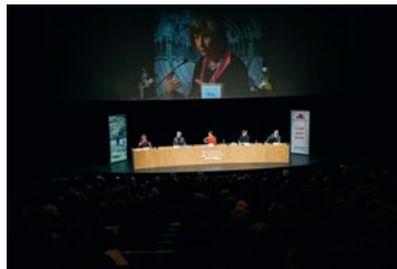
Rencontres d'Averroès, Marseille.