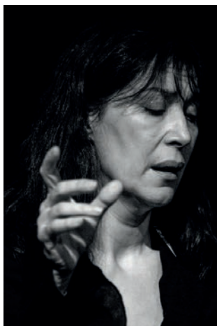
Anne Alvaro