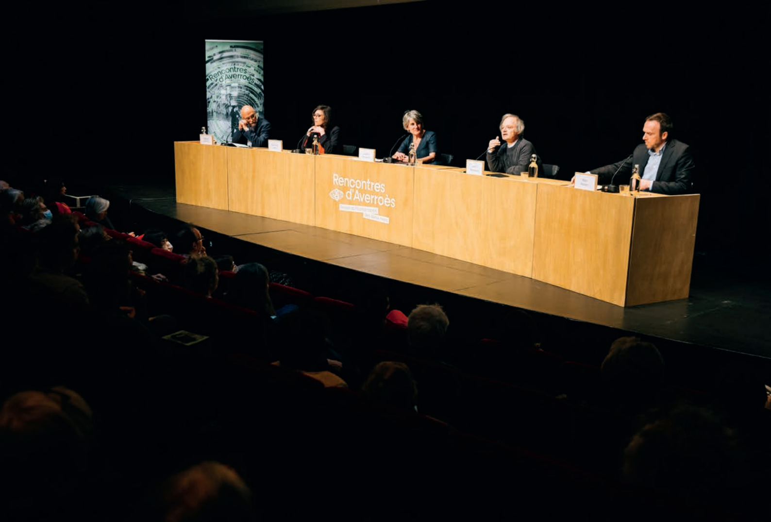
Rencontres d'Averroès, théâtre de La Criée, novembre 2022.