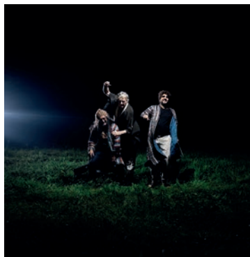
Mademoiselle © Christophe Urbain